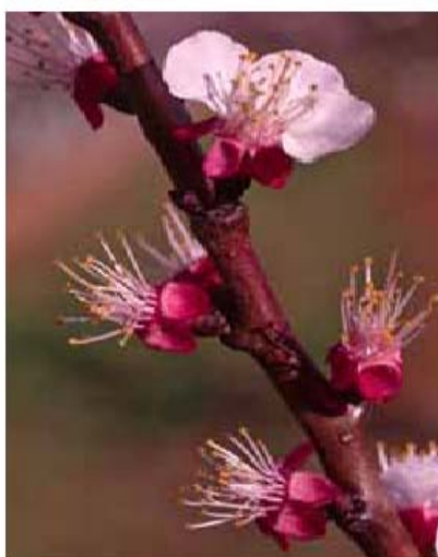
Stade G: chute des pétales