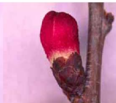
Stade C: calice visible