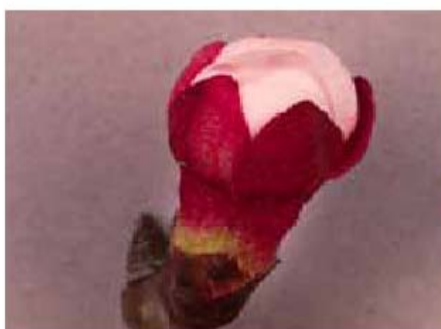
Stade D: corolle visible