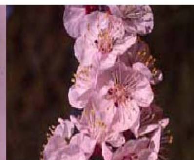
Stade F: fleur ouverte