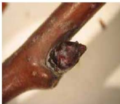
Stade A: bourgeon d'hiver