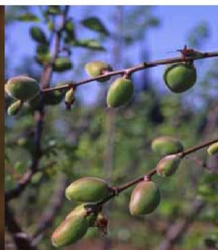
Stade I: jeune fruit