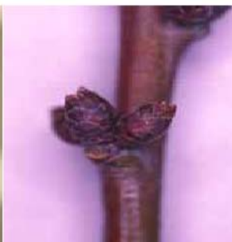
Stade B: bourgeon gonflé