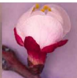
Stade E: étamines visibles